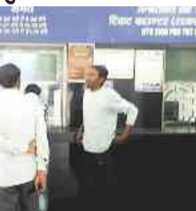
टिकट काउंटर में टिकट लेते लोग।