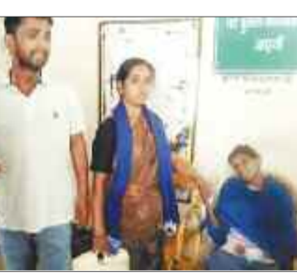
शिकायत करने पहुंचे प्राथी।

मैडिकल कॉलेज अस्पताल में मरीजों सहित डॉक्टर व चिकित्सा स्टाफ की सुरक्षा के लिए सालाना 1 करोड़ के ठेके पर कामथेन सिक्योरिटी एजेंसी को नियोजित किया गया है। एजेंसी ने वर्दीधारी गार्डों के साथ ही अलग से महिला व पुरुष बाउंसरों की तैनाती की है। लेकिन बाउंसर अस्पताल में खुद धात लगा रहे हैं और ड्यूटी करते हुए वहां मरीजों से मिलने या देखरेख के लिए पहुंचे परिजनों से बदसलूकी और मारपीट करने का आरोप लगा है। बाउंसरों के इस तरह दबंगई अस्पताल परिसर में पहुंचने वाले लोग पर कड़ी कार्यवाही कर सकता है।