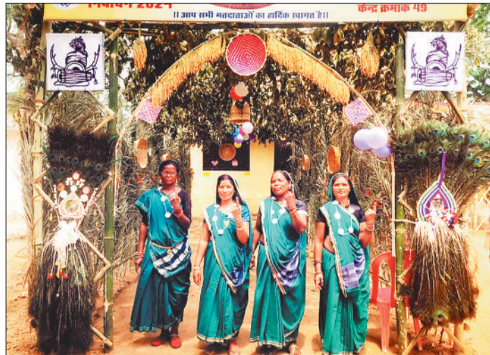
विशेष रूप से सजाया गया था मतदान केंद्र बगिया।