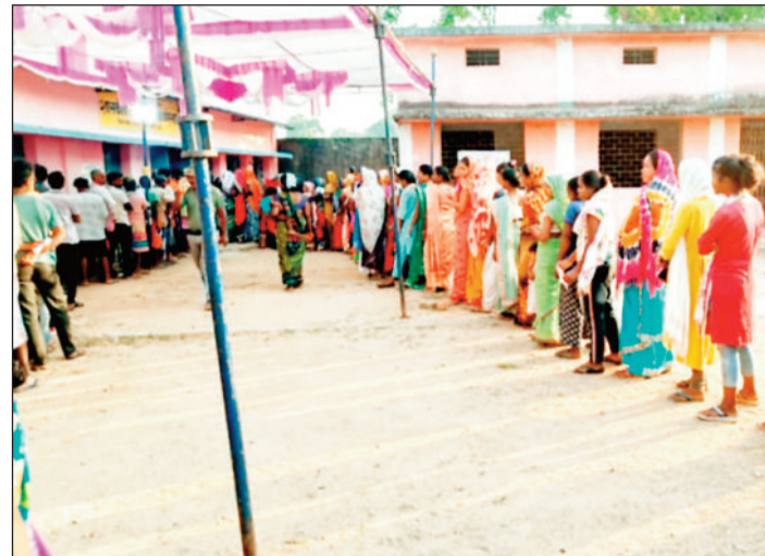
पथलगांव के मतदान केंद्र में लगी लंबी लाइन।

मतदाताओं में भारी उत्साह, मतदान करने लगी लंबी-लंबी लाइन, केन्द्रों में किए गए सुरक्षा के पुख्ता इंतजाम