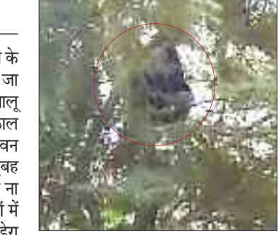
लाल घेरे में पेड़ में चढ़ा भालू।

जंगल से भटककर एक भालू मड़वारानी के समीप मुख्य मार्ग से लगे एक पेड़ पर जा पहुंचा। जब सुबह ग्रामीणों की नजर भालू पर पड़ी तो उनके होश उड़ गए और तत्काल इसकी सूचना वन विभाग को दी गई। वन विभाग की टीम मौके पर पहुंची और सुबह से देर शाम तक कोई जन धन की हानि ना हो इसके लिए आसपास के ग्रामीण क्षेत्रों में अलर्ट जारी कर वन अमले की टीम भी डेरा डाली रही। देर शाम के बाद भी भालू पेड़ पर बना हुआ है।