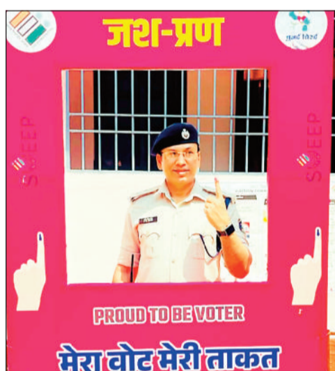
मतदान के बाद चिन्ह दिखाते एस्पी।