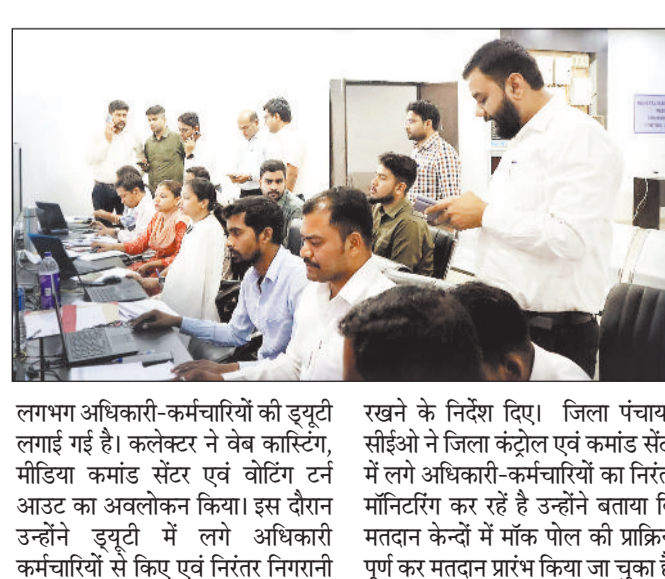
लगाभग अधिकारी-कर्मचारियों की ड्यूटी लगवाई गई है। कलेक्टर ने वेब कास्टिंग, मीडिया कमांड सेंटर एवं वॉटिंग टर्न आउट का अवलोकन किया। इस दौरान उन्होंने ड्यूटी में लगे अधिकारी कर्मचारियों से किए एवं निरंतर निगरानी रखने के निर्देश दिए। जिला पंचायत सीईओ ने जिला कंट्रोल एवं कमांड सेंटर में लगे अधिकारी-कर्मचारियों का निरंतर मॉनिटरिंग कर रहे हैं उन्होंने बताया कि मतदान केंद्रों में मांक पोल की प्रक्रिया पूर्ण कर मतदान प्रारंभ किया जा चुका है।

कलेक्टर डॉ रवि मित्तल एवं जिला पंचायत सीईओ श्री अभिषेक कुमार ने कलेक्ट्रेट में बनाए गए जिला कंट्रोल एवं कमांड सेंटर का निरीक्षण किया। लोकसभा निर्वाचन 2024 के सूचारू से संचालन के लिए जिला कलेक्ट्रेट के मंत्रणा सभा कक्ष में कमांड सेंटर तैयार किया गया है एवं शिकायतों के निवारण के लिए कंट्रोल रूम तैयार किया गया है। कलेक्टर डॉ रवि मित्तल ने जिले के तीनों विधानसभा जशपुर, कुनकुरी एवं पथलगांव के लिए वॉटिंग टर्न आउट सेक्शन, मीडिया कमांड सेंटर वेब कास्टिंग तथा तथा शिकायत माउडेंटिंग कक्ष का निरीक्षण किया। जिसमें जिले के तीनों विधानसभा के लिए अलग-अलग