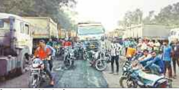
दीपका बाईपास मार्ग में खड़े भारी वाहन।