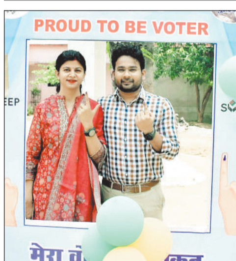
जिप सीईओ ने अपनी पत्नी के साथ किया मतदान।