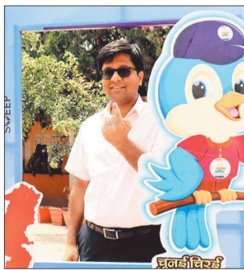
कलेक्टर डॉ रवि मित्तल सेल्फी जोन में।

जशपुरनगर। राष्ट्रीय सेवा योजना और स्काउट गाइड वालंटियर्स मतदान केंद्रों में बुजुर्ग मतदाताओं की मदद करने में सहायता कर रहे हैं। तस्वीर में कुनकुरी विधानसभा के टंगरटोली मतदान केंद्र क्रमांक 131 में बुजुर्ग मतदाता की सहायता करते एन.एस.एस. के स्वयंसेवक देखे जा सकते हैं। एक और तस्वीर कुनकुरी से आ रही है।