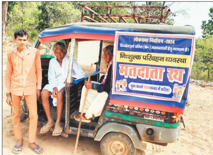
बुजुर्गों के लिए सरकार ने की थी मतदान रथ की व्यवस्था।